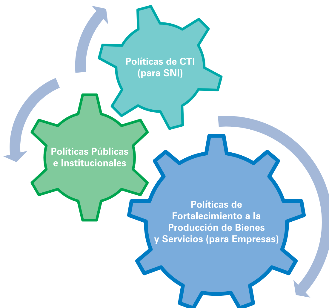
Figura 1: Ámbitos e interacciones en la construcción de una política de Estado para la biotecnología